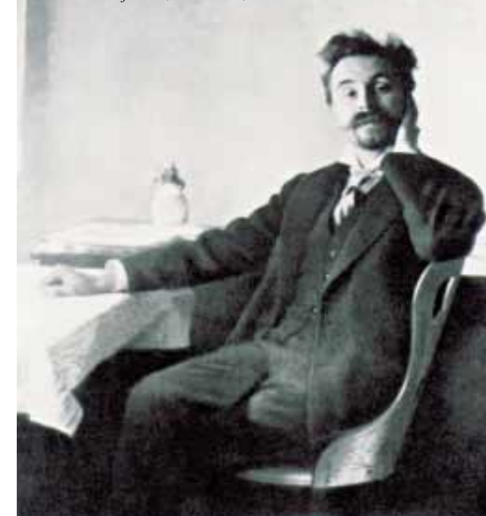
Aleksandr Skrjabin (1872-1915)

Ilden, ekstasen, det guddommelige, mysteriet og såvel den sorte som den hvide magi synes hos Skrjabin at være flere sider af samme sag. Det er ikke for ingenting, at det sidste, korteste, men også mest ambitiøse af Skrjabins seks store orkesterværker har fået navn efter Prometheus, der i den græske mytologi stjal ilden fra guderne – Prometheus (Le poème du feu) (1909-10). Den oprindelige historie ender med en grusom straf over Prometheus – han lænkes til en ▶