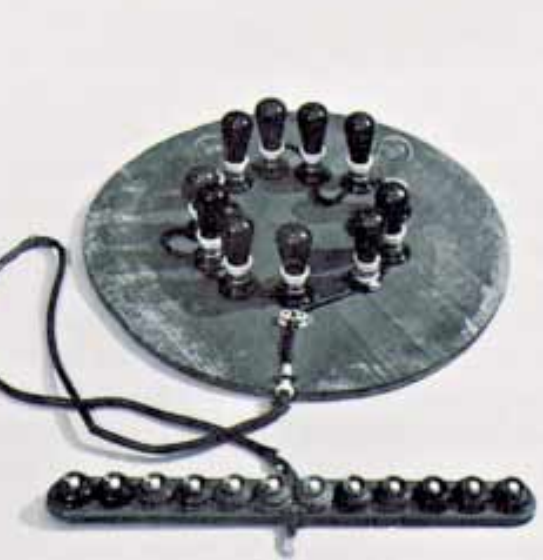
Et af de første forsøg på at realisere Skrjabins lysklaviatur

klippe og bliver hver dag hakket i leveren af en ørn – men hos Skrjabin er det selve fremskaffelsen af ilden, musikken sætter i scene.